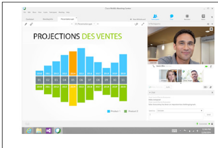
Figure 1 : Partage de contenu pendant une réunion

Partagez en temps réel des contenus ou votre écran tout entier. Transférez le contrôle à d'autres participants afin qu'ils puissent partager du contenu ou annoter le vôtre. L'illustration 1 montre le contenu qui est partagé par l'intervenant actif et les autres participants à la réunion.