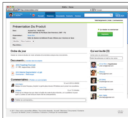
Figure 2 : Les espaces dédiés permettent de rationaliser les activités organisées pendant la réunion et de faciliter le partage de contenu